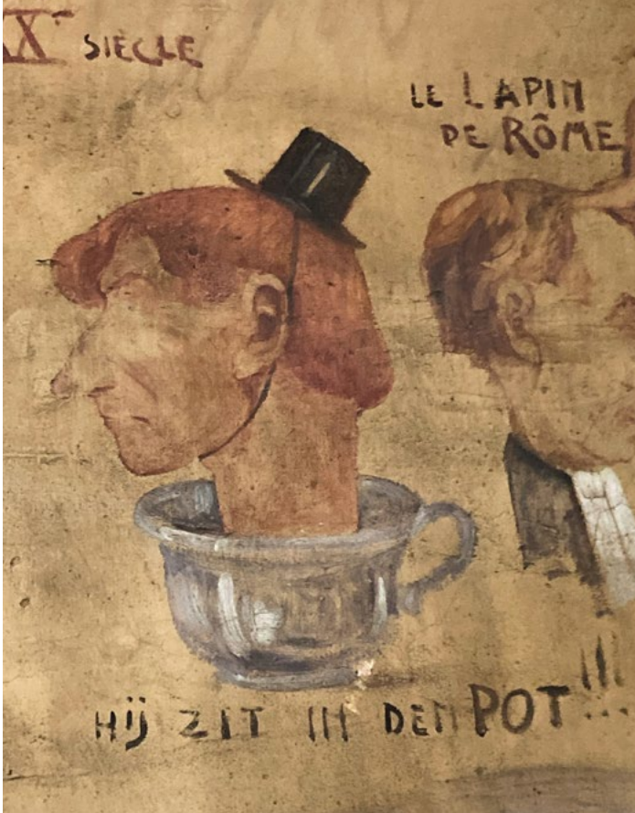
Joe English, zelfportret, “ Hij zit in den pot!!! ” olieverf op kamerwand, 40 x 35 (?) zd. (1904- 1907?)